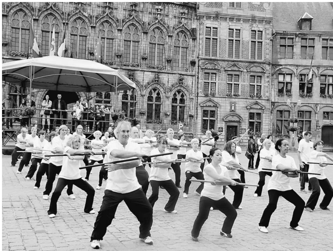
欧洲气功爱好者在运动会上演示养生太极杖。